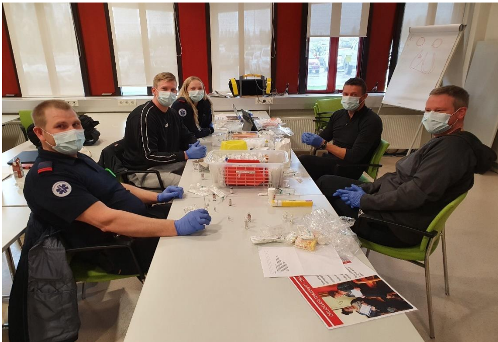
Nokkrir nemendur í framhaldsnámi í Lotu 1 á Akureyri ásamt leiðbeinanda.

Á árinu 2020 voru haldin 27 námskeið (voru 62 árið 2019) og var heildarfjöldi þátttakenda 238 (voru 567 árið 2019). Fjöldi námskeiða og nemenda í grunn- og framhaldsnámi í sjúkraflutningum er nokkuð stöðugur milli 2019-2020 en talsverð fækkun var í endurmenntunarnámskeiðum og vettvangshjálp, að mestu vegna Covid 19, sem hafði mikil áhrif á skólastarfið á árinu.